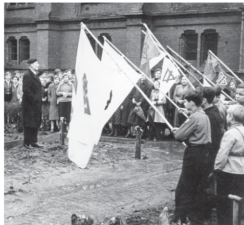
Grundsteinlegung des Jugendheims

Für die Ausstellung suchen wir schon jetzt Erinnerungsstücke, also Fotos aus den verschiedenen Epochen, aber auch Gegenstände (Konfirmandenmappen, Plattenclub-Ausweis, Wimpel und anderes). Alle Leihgaben erhalten die Besitzer garantiert zurück.