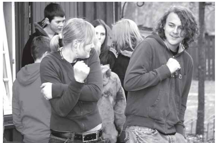
Gute Gemeinschaft in Wildflecken oder Ahlhorn

In Bant bleibt es bei den beiden bewährten Formen der Konfirmandenzeit: die Gruppen der FORM A treffen sich wöchentlich, die Konfirmanden der FORM B erleben ihre Konfirmandenzeit in den Ferien in 5 Seminaren im Blockhaus Ahlhorn und 2 Seminaren zu Hause im Gemeindehaus.