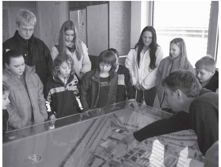
Besichtigung der Kläranlage

Eigentlich sollte es ja wieder eine Kinderfreizeit geben - aber die war wohl zu teuer! Die Gruppenleiterinnen des Banter Kindertreffs haben deshalb überlegt: Ferien zu Hause in Wilhelmshaven sind auch ganz prima. Unter dem Thema Stadt, Land, Fluss wollen sie mit den Kindern die Stadt und auch die Umgebung erkunden. Ein verkehrssicheres Fahrrad sollte bei den Teilnehmerinnen und Teilnehmern vorhanden sein, denn wer will schon gern aufs Land laufen!? Die Kinderferienwoche findet vom 20.7.-27.7.an (fast) allen Wochentagen von 14-18 Uhr statt. Eine Teilnahme an einzelnen Tagen ist aus organisatorischen Gründen leider nicht möglich. Für Sonntag, den 23.Juli, sind dann Eltern, Geschwister und alle anderen zum Familiengottesdienst in die Banter Kirche und zu einem anschließenden gemeinsamen Fahrradausflug mit Grillen eingeladen. Der Teilnehmerbeitrag von 25 € schließt alle Materialkosten, täglich eine Erfrischung, die Betreuung und die Ausflüge in die Umgebung ein. Teilnehmen können alle Mädchen und Jungen ab 1. Klasse. Anmeldungen ab sofort im Gemeindebüro der Kirchengemeinde Bant. Die Zahl der Teilnehmerplätze ist begrenzt.