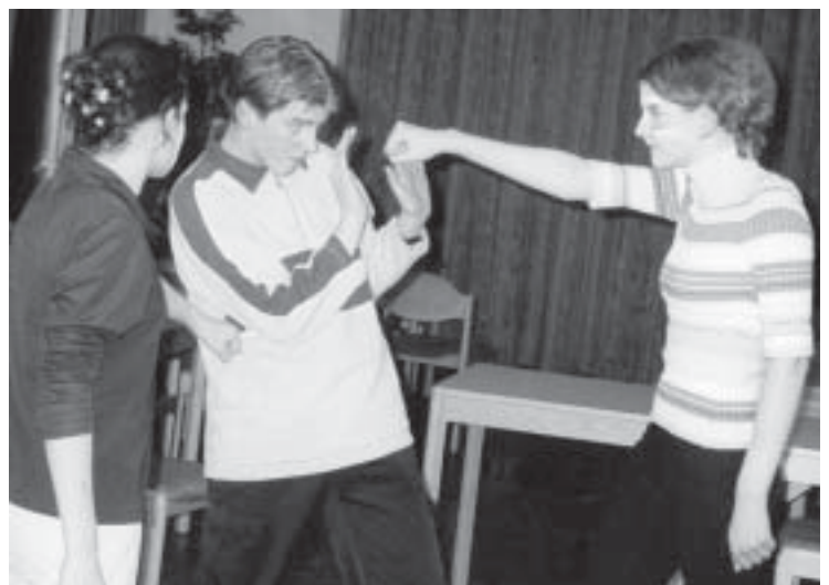
Einige der Jugendlichen der neuen Jugendgruppe

Schon vor ihrer Konfirmation im Mai treffen sich Konfirmanden/innen montags um 16.45 Uhr in einer neuen Jugendgruppe. Die Jugendlichen spielen gern Theater, doch auch Diskussionen, Spiel, Ausflüge und die Beteiligung am Gemeindeleben sind geplant. So ist eine kreative, lebendige und fröhliche Gruppe im Entstehen, die noch offen für weitere Leute ist, die in diesem Jahr konfirmiert werden.