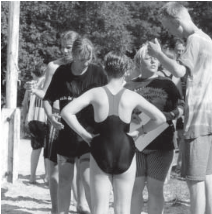
Ein schöner Rücken kann auch entzücken... hier bei der Freizeit in Ahlhorn im vergangenen Sommer.

200 DM kostet die Fahrt vom 7.-13. August. Anmeldung bis zum 1. Juni im Gemeindebüro. Leitung: F. Morgenstern u. Team.