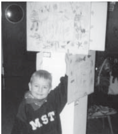
Der neue Picasso

„Malen wie die Großen“, das wollten auch unsere Kinder in der Bärengruppe im Kindergarten an der Adalbertstraße. Auf den Spuren großer Künstler stellten die Kinder selbständig Farbe her, mit der sie dann eigene Kunstwerke schufen. Diese Kunstwerke waren für zwei Wochen im Foyer unserer Einrichtung ausgestellt und für alle Interessierten zugänglich. So manches Bild läßt schon ein gewisses Talent erkennen. Die Spuren der Großen sind gefunden und werden weiter verfolgt.