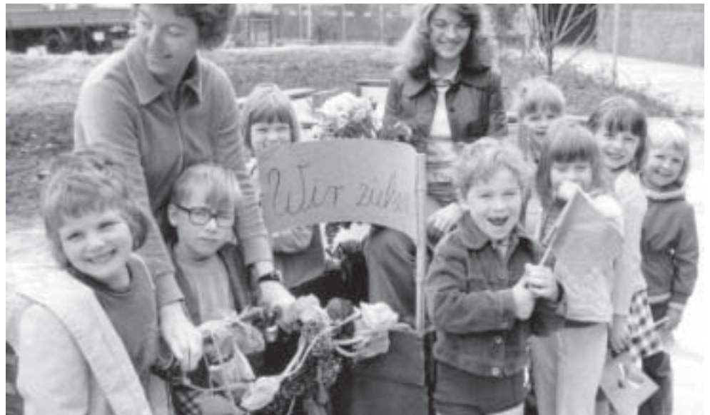
Umzug in den neuen Kindergarten Bant II am 20. Mai 1975

Unter dem Motto „Mit allen Sinnen die Welt entdecken“ laden die Mitarbeiterinnen der Kindertagesstätte gemeinsam mit R. Ewald zum Gottesdienst am 6. Mai um 14.30 Uhr in die Banter Kirche ein. Im Anschluß findet im Festzelt an der Kindertagesstätte ein Empfang statt. Eine Kinderbetreuung wird angeboten. Alle Interessierten, jetzige und ehemalige Kinder, Eltern und Kolleginnen sind herzlich eingeladen.