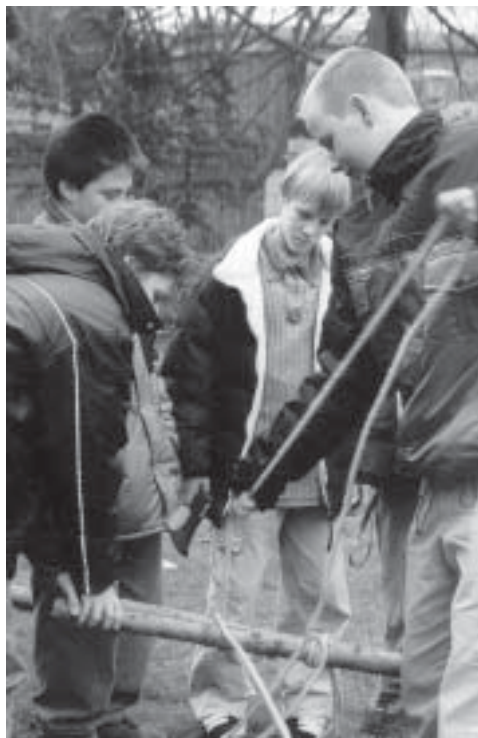
Banter Likedeeler beim Zeltaufbau. Gute Kenntnisse in Pfadfindertechnik sind unerlässlich.