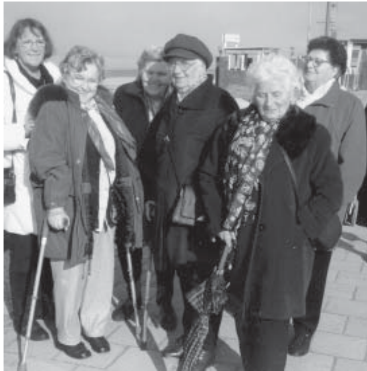
Bei schönem Wetter an der See sind die Frauen des Frauenkreises Bant Nord guter Dinge. Hier sind sie in Dangast unterwegs.