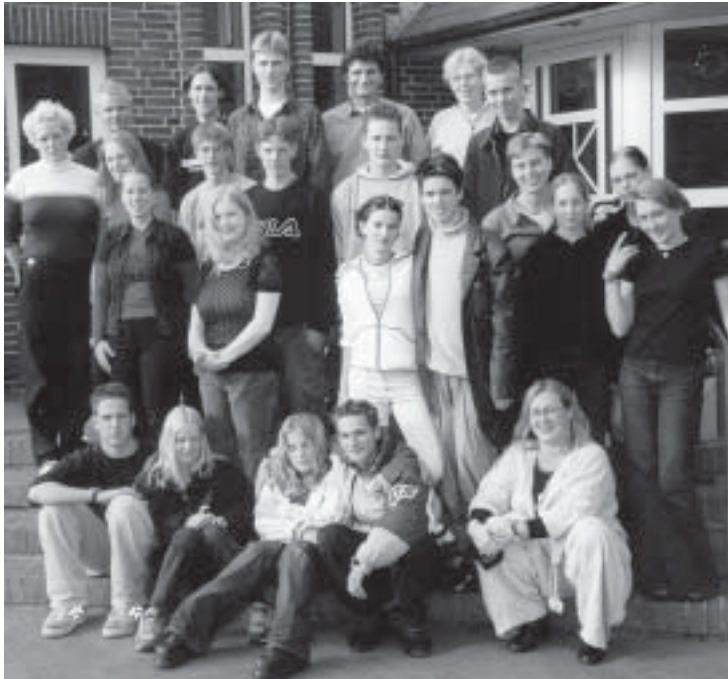
Alte und neue Mitarbeiter/innen der Ev. Jugend Bant

Elf neue Mitarbeiter/innen der Ev. Jugend Bant sind seit den Sommerferien aktiv. Sie übernehmen ehrenamtlich verschiedene Aufgaben: Bei den Pfadfindern/innen leiten sie nach den Herbstferien Gruppen der Kinderstufe und der Pfadfinderstufe, bereiten gemeinsam ihre Programme vor und fahren mit den Gruppen auf Lager.