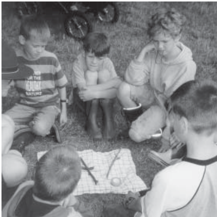
Beim Detektivtraining suchen die Likedeeler nach Spuren

Als Detektive haben sich die Pfadfinder/innen der Kinderstufe während ihres diesjährigen Sommerlagers bewährt.