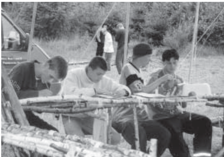
Einige der neuen Mitarbeiter auf dem Sommerlager in Schweden bei der Vorbereitung eines Geländespiels für die Gruppe

Im Bereich Konfirmandenarbeit begleiten sie die sechs Konfirmandengruppen des neuen Jahrgangs, nehmen am Unterricht teil und fahren in den Herbstferien mit auf die Konfirmandenseminare. Die Vorbereitung von Gottesdiensten und Gemeindeveranstaltungen - der Adventsbasar steht schon vor der Tür - gehört zum Engagement in der Ev. Jugend Bant dazu. So kennen die Neuen es von ihren Vorgängern/innen.