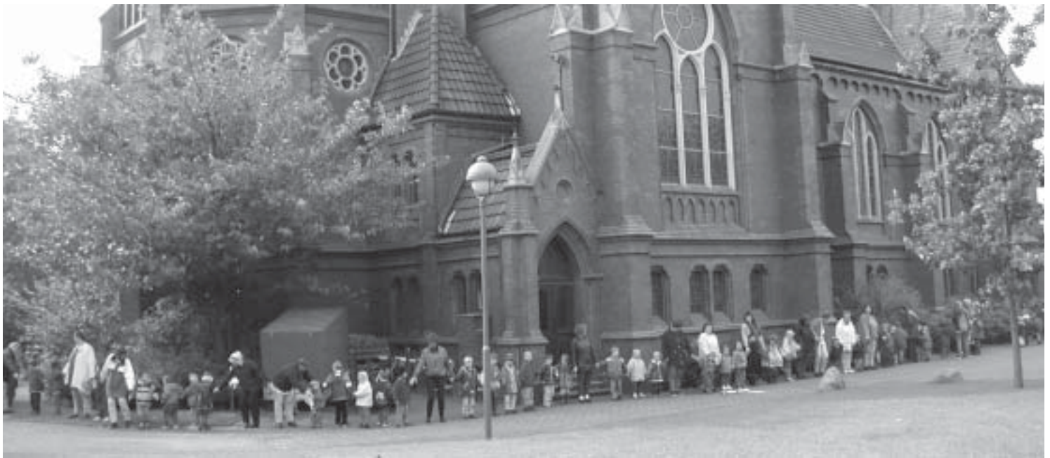
Angetan von der Idee der Christus- und Garnisonkirche zum Weltkindertag machten sich auch die Kinder, Eltern und Erzieherinnen der Banter Kindertagesstätten daran, nach einer Andacht „ihre“ Banter Kirche zu umarmen.