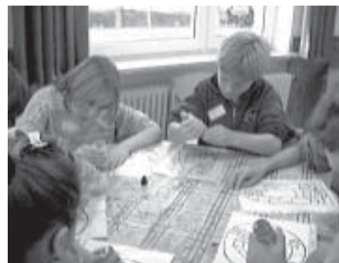
Viel Programm gibt es bei den Kinderfreizeiten. Im Advent werden Geschenke gebastelt und Weihnachtslieder gesungen.

Wir werden Weihnachtsgeschenke basteln und Advents- und Weihnachtslieder singen. Es gibt Spiele und eine Nachtwanderung mit anschließender Feier »Weihnachten im Walde«. Die Kosten betragen 50 DM. Auskunft und Anmeldungen bei Ursula Aljets oder im Gemeindebüro Bant.