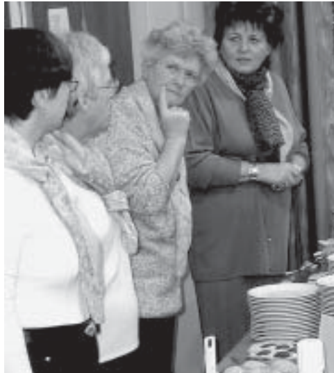
Fleißige Frauen sind bei Gemeindeveranstaltungen unentbehrlich.