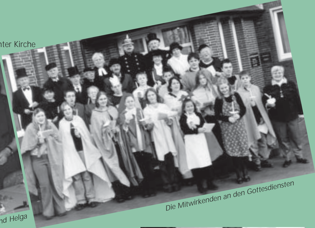
Die Mitwirkenden an den Gottesdiensten