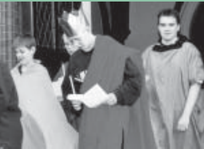
onin Aljets, Kaiser Augustus und Gefolge