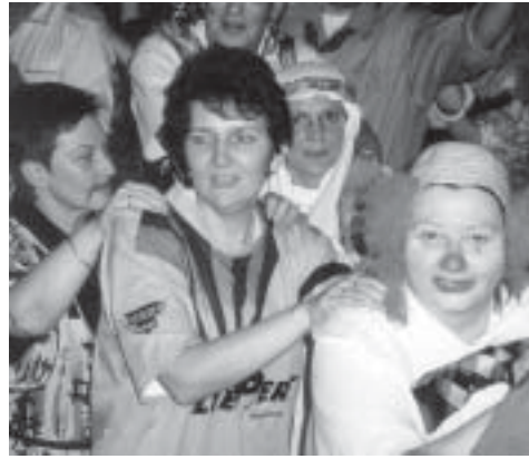
Der Faschingsball der Kindertagesstätten hat eine lange und gute Tradition

Die Kindertagesstätten bereiten wie in jedem Jahr einen Faschingsball für Erwach-