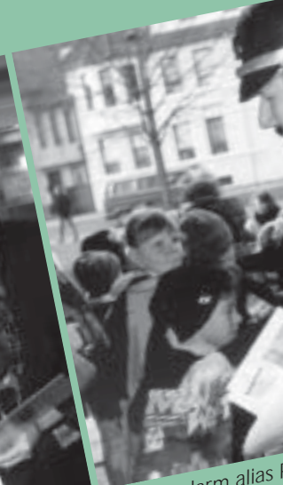
Der Gendarm alias...