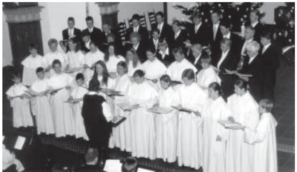
Da sind sie nun, die neuen Gewänder der Kantorei. Lange wurde diskutiert und ausgewählt, damit die gespendeten Gelder auch richtig investiert wurden.