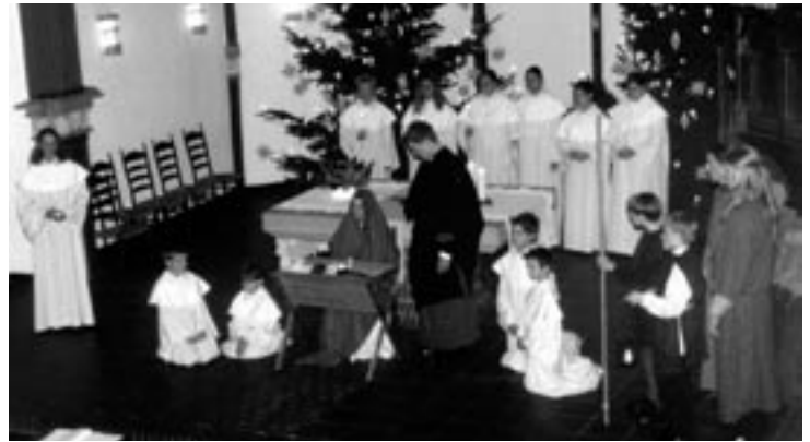
Banter Kantorei und Kinderchor beim Mettenspiel am 1. Weihnachts-

Ein neues Krippenspiel, geschrieben von Marco Stickel vom Stadttheater Wilhelmshaven, gibt es am Heiligabend um 15 Uhr in der Christuskirche für Familien mit Kindern. Gestaltet wird es gemeinsam mit SchauspielerInnen, Eltern und Erzieherinnen. Dabei wird der Erzengel Gabriel den Weg durch die Weihnachtsgeschichte suchen und mit Hilfe der Kinder gewiß auch finden!