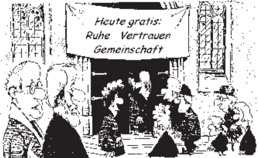
„Siehst Du, die Menschen brauchen die einfachen Dinge am nötigsten“

Auch über die Bedeutung und Verwendung der Kirchensteuer kann man sich informieren. Natürlich funktioniert eine Steuer nicht nur nach dem Motto: Was hab' ich davon? Gerade von der Kirchensteuer haben auch viele andere Menschen etwas, mit denen ich durch mein Geld solidarisch verbunden bin. Jeder gezahlte Beitrag sorgt mit dafür, daß die Kirchen in Deutschland PastorInnen beschäftigen können, die sich um viele Menschen kümmern können, denen es nicht gut geht. Oder die eben keine Kirchensteuer mehr zahlen wie z.B. RentnerInnen. Wussten Sie z.B. daß die Brot-für-die-Welt-Spenden zu 100 Prozent an notleidende Menschen weitergegeben werden können, weil die notwendige Verwaltung dieser Einrichtung von unseren Kirchensteuern finanziert wird?