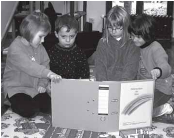
Bilderschätze haben in einem Begegnungsgottesdienst am Reformationstag die KiGAs der Südstadt (Christus Kindergarten, Kindergarten Inselviertel, KiGa Leuchtfeuer, Kinderspielhaus Moselstraße, Südstern) zusammengetragen. 300 Kinder gestalteten mit P. Busemann einen Bibelschatz.