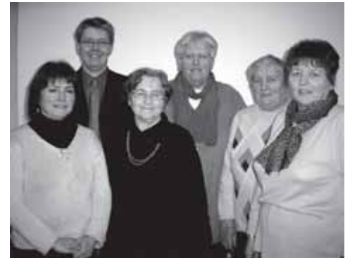
Wechsel im Frauenkreis!

Ab Aschermittwoch, dem 25. Februar treffen sich um 19.30 Uhr im Gemeindehaus, Werftstr. 75, alle, die auch in diesem Jahr fasten wollen. Fasten bedeutet im evangelischen Sinne freier zu werden, indem man sich bewusst entscheidet, auf eine lieb und lästig gewordene Angewohnheit zu verzichten. Die Gruppe trifft sich jeden zweiten Mittwoch nach der Passionsandacht (25.2./10.3./24.3.). Das letzte Treffen findet am Karfreitag, dem 9.04. nach dem Gottesdienst um ca. 11.30 Uhr statt. Die diesjährige Aktion steht unter dem Motto 'auf!klären'.