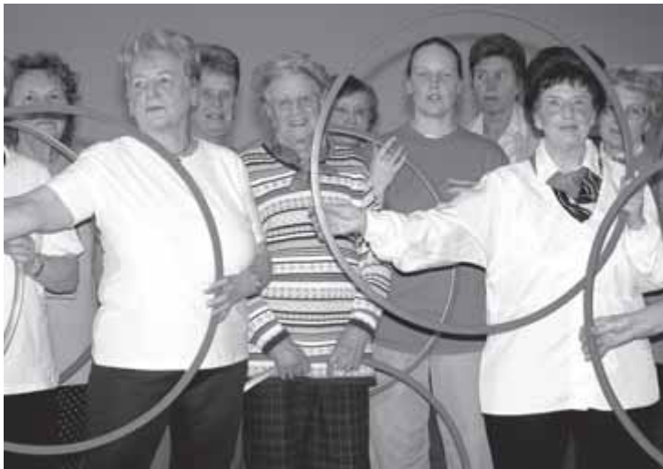
Sport, Spiel, Tanz, Reisen, Vorträge, Feste feiern: Der Banter Altenclub