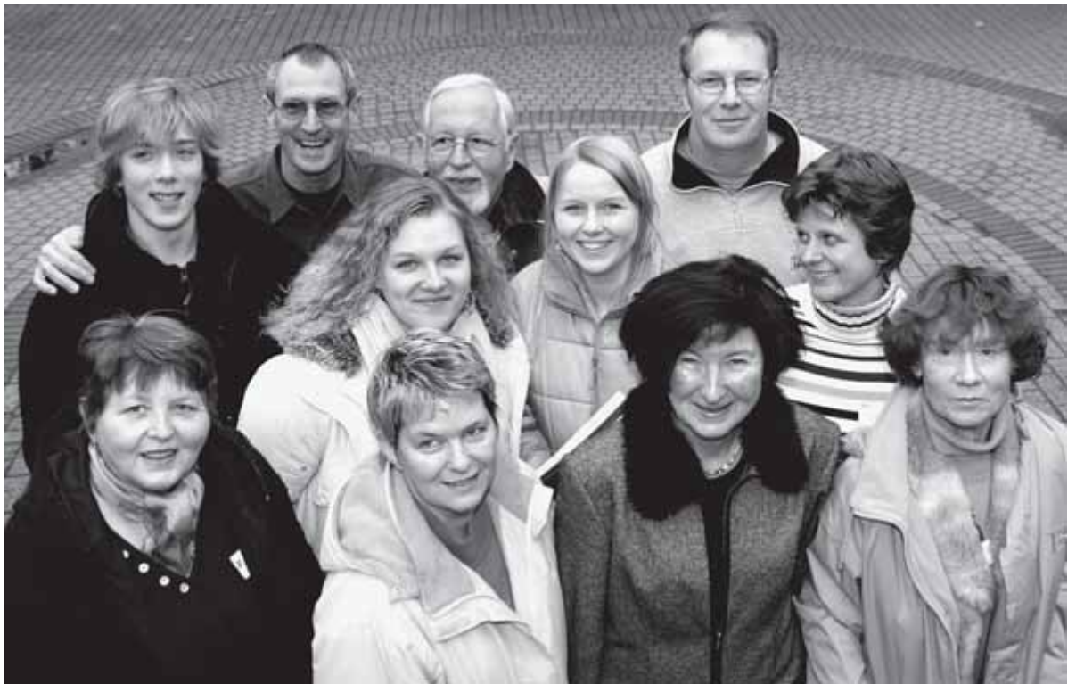
Teilnehmerinnen und Teilnehmer am Lektorenkurs

Der Wahlsonntag 26. März soll in beiden Kirchen und Gemeindehäusern ein Festtag sein. Gottesdienste um 10 Uhr gehen dem Beginn der Wahl voraus. Von 11 bis 18 Uhr sind die Wahllokale und auch die Wahlcafés geöffnet. Dann beginnt die öffentliche Auszählung der Stimmen. Die Möglichkeit der Briefwahl, ein mobiles Banter Wahllokal für die Altern- und Pflegeheime und ein