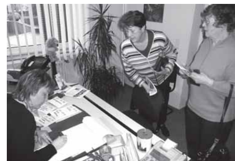
Großer Andrang herrschte am Tag der Anmeldung für die Banter Ausflugsfahrten. Viele Fahrten waren schon nach kurzer Zeit ausgebucht. Wiesmoor, 30. April, noch wenige Plätze frei

Wir laden ab Mittwoch, dem 15. April, zum neuen Glaubenskurs für Erwachsene ein, die ihre Taufe bzw. Konfirmation nachholen wollen. Die Treffen finden mittwochs um 19 Uhr im Gemeindehaus, Werftstr. 75, statt. Ziel des Kurses ist die Konfirmation am 7. Juni. Die Leitung hat Frank Moritz. Anmeldung bitte ab sofort im Gemeindebüro. Die Teilnahme ist kostenlos.